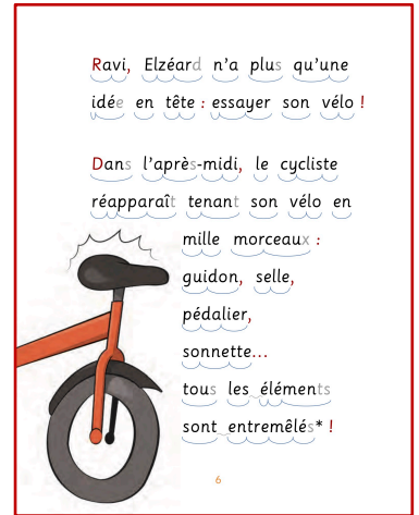
Exemple d'un livre « adapté »