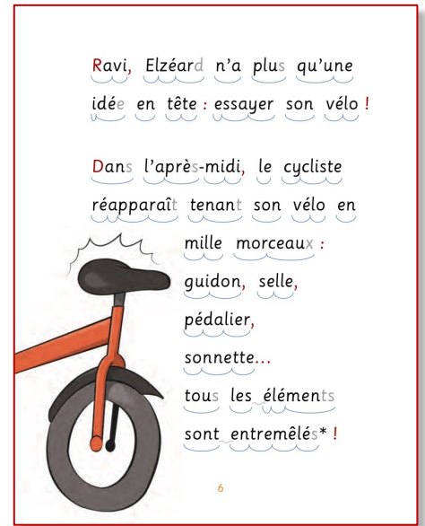
Exemple d'un livre adapté

Alternance de mots en couleurs avec ponts